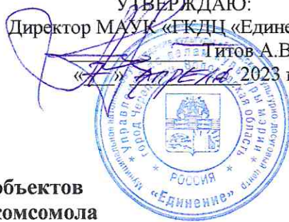
Схема размещения нестационарных объектов на территории парка им. Ленинского комсомола на период с 1 мая 2023 г. по 30 апреля 2024 г.